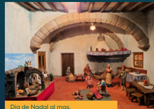
Dia de Nadal al mas. Fent cagar el tió