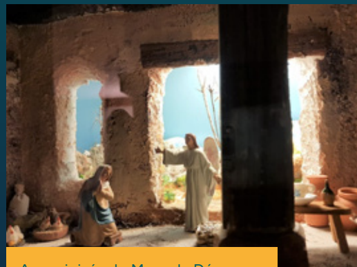
Anunciaicó a la Mare de Déu