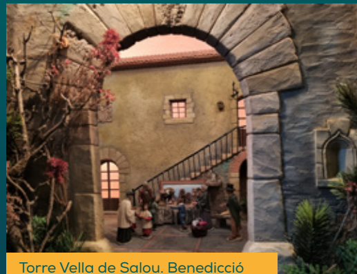
Torre Vella de Salou. Benedicció del pessebre

Us convidem a gaudir d'aquesta mostra nadalenca, tot esperant que gaudiu d'un Nadal pròsper i amb salut.